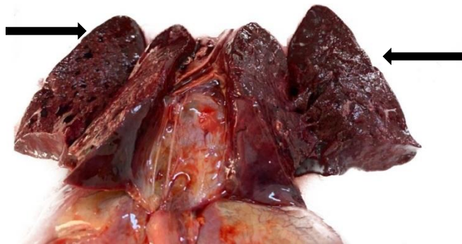
легкие новорожденного ребенка, мама которого переболела COVID-19 во время беременности (по плотности легкие такие же, как ткань печени)

Женщинам, в том числе, планирующим беременность и беременным, важно знать, что заболевание, вызванное коронавирусом COVID-19, во время беременности сопряжено с более высоким риском тяжелого течения инфекции у самой женщины и развития серьезных осложнений, угрожающих жизни и здоровью ее ребенка. У будущих мам намного выше риск преждевременных родов и появления на свет недоношенных детей. Кроме того, новорожденные дети у мам, перенесших инфекцию, чаще других нуждаются в проведении интенсивной терапии в условиях отделения реанимации. Приходится говорить и о более высоком показателе перинатальной смертности (гибель малышей внутриутробно или в первые 7 дней после рождения) и материнской смертности женщин, заболевших коронавирусной инфекцией во время беременности. Инфекция COVID-19 у матери может привести к внутриутробному поражению легких плода.