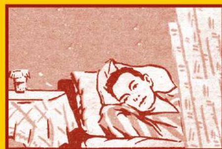
Избегайте контактов с заболевшими