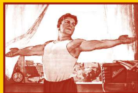
Ведите здоровый образ жизни